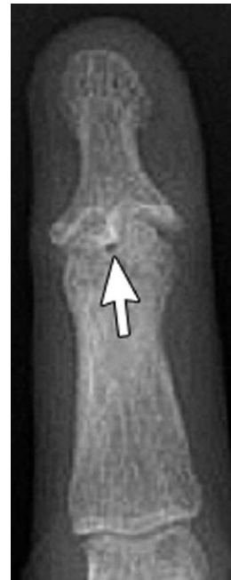
Artritis psoriásica Artrosis erosiva